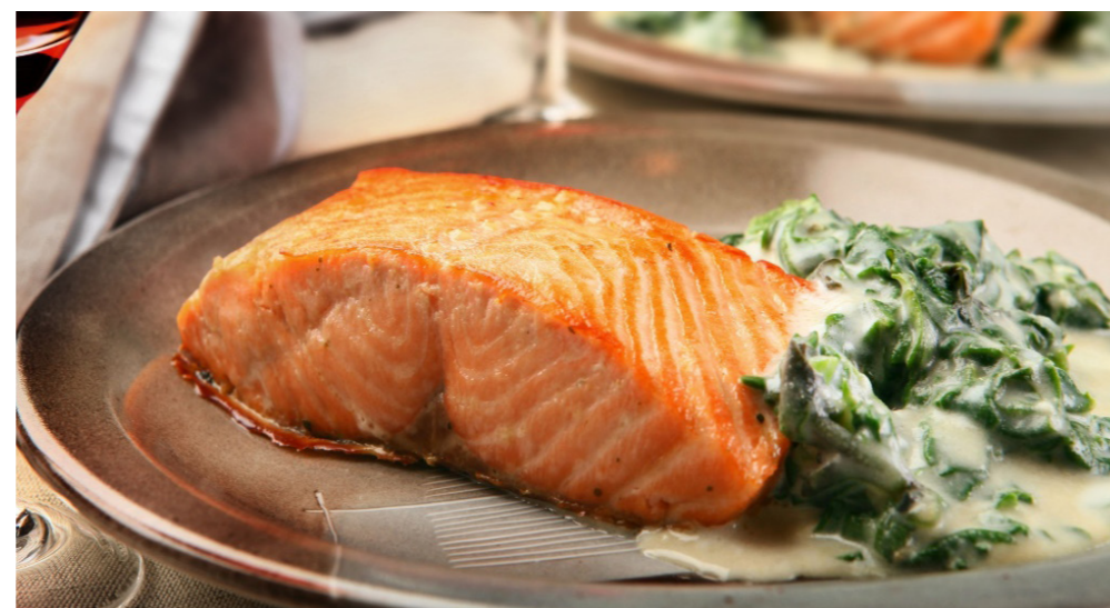
Posta de Salmão, creme de espinafre e fritas rústicas