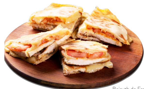
Beiruth de Frango