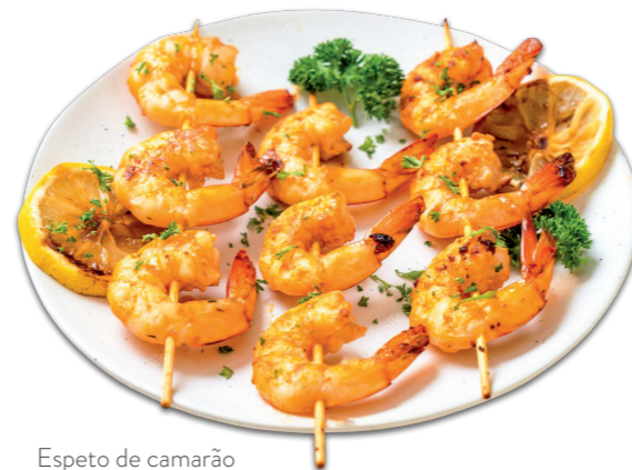
Espeto de camarão