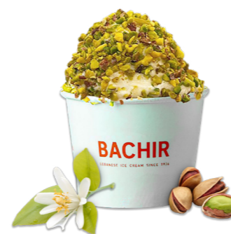
Ashta com pistache